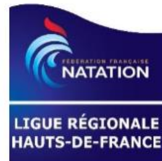
TABLEAU SYNOPTIQUE DE LA FORMATION DES OFFICIELS NATATION COURSE