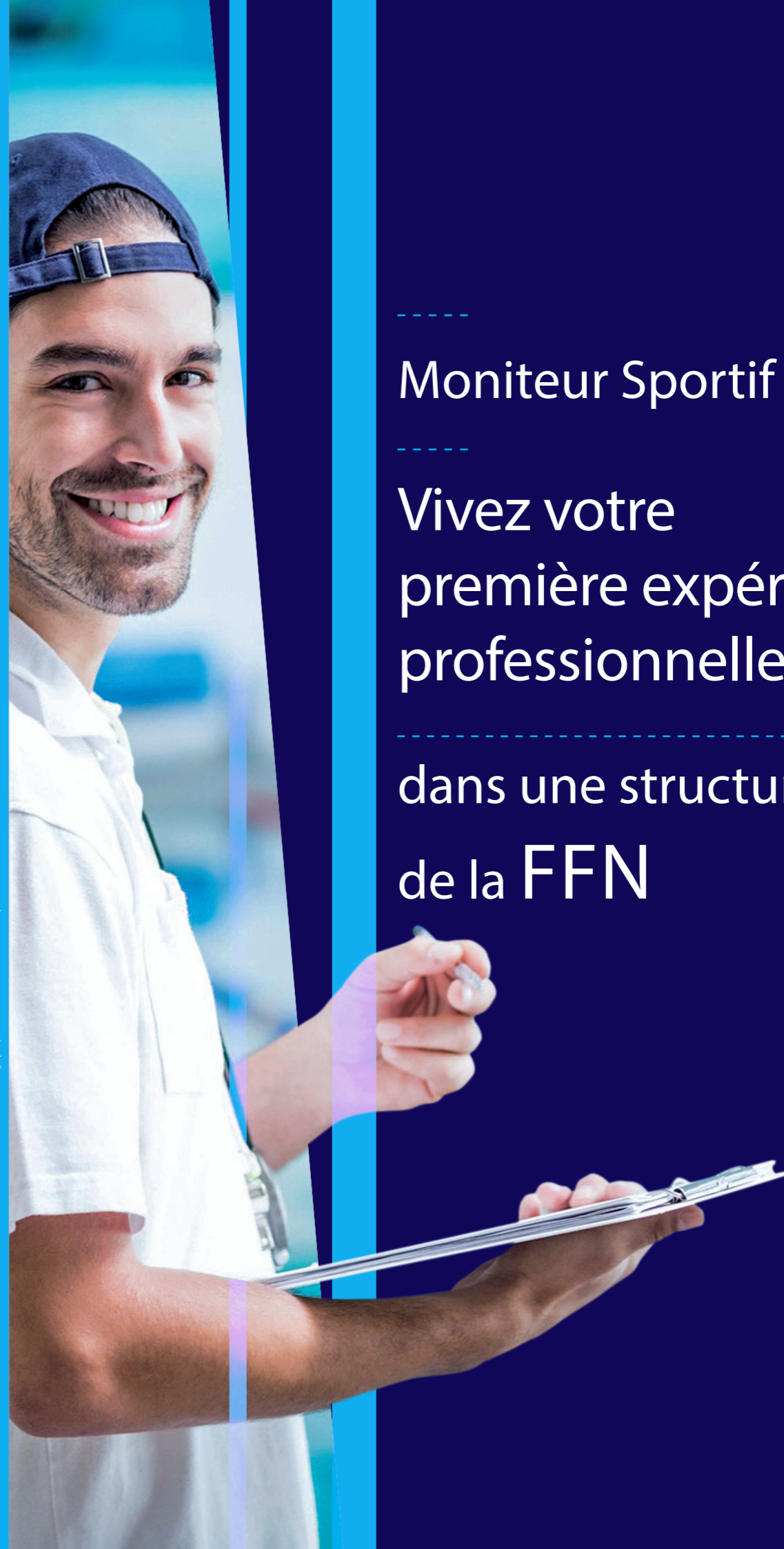
Création graphique: NA-DISEIGN/10/2016